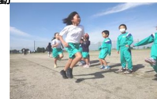
【縦割り班対抗全校リレー】